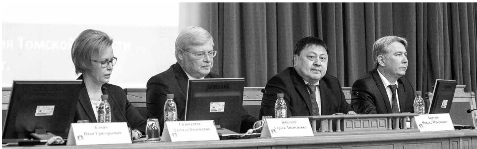
Финансирование системы здравоохранения